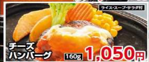
ライス・スープ・サラダ付