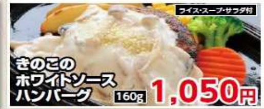
ライス・スープ・サラダ付