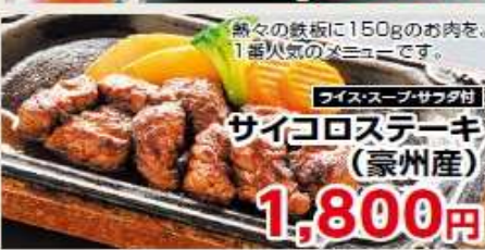
ライス・スープ・サラダ付

熱々の鉄板に150gのお肉を。 1番火気のステーキです。 サイコロステーキ (豪州産) 1,800円