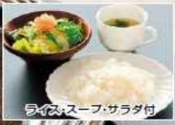
ライス・スープ・サラダ付