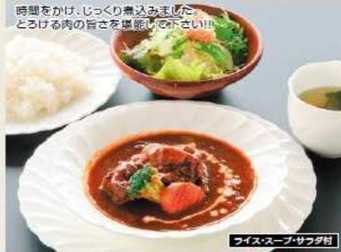
ライス・スープ・サラダ付

能登牛 ビーフシチュー 2,500円 ※ライスは能登町棚田産コシヒカリを使用しています。