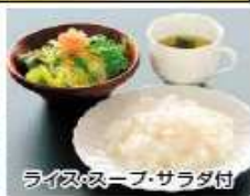
ライス・スープ・サラダ付