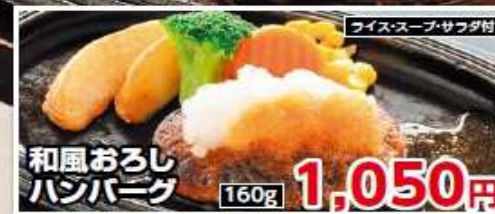
ライス・スープ・サラダ付