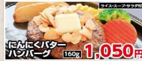
ライス・スープ・サラダ付